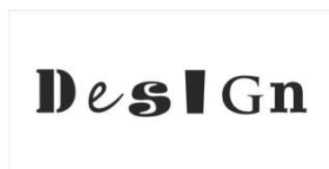
Máscara Verniz - Frente