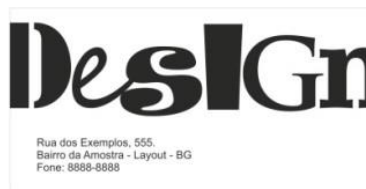
Máscara Verniz - Verso

Para aplicar em fotos a cor da máscara você precisa recortá-las.